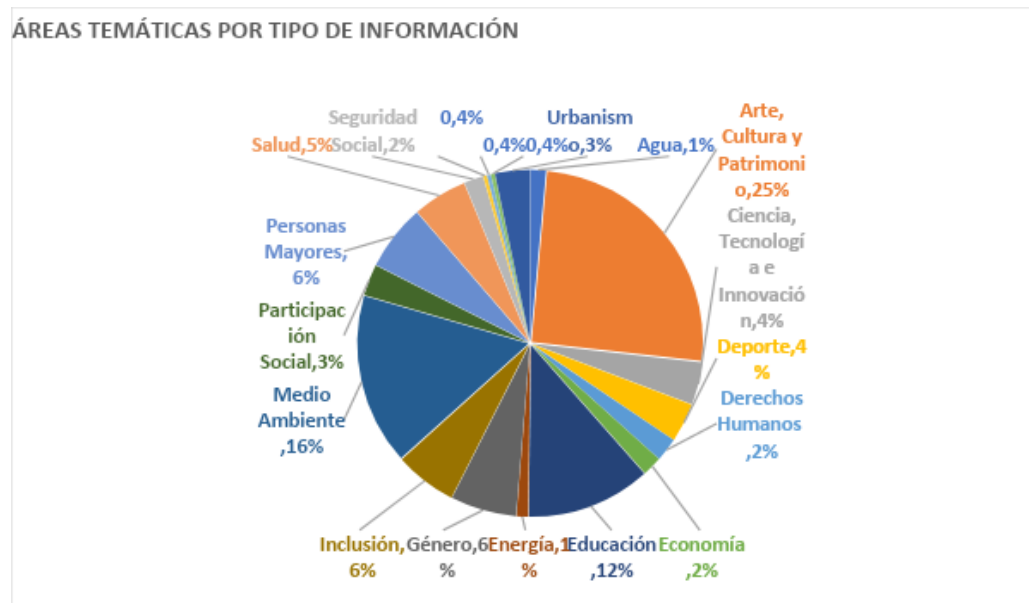
Gráfico 1. Porcentaje de publicaciones por áreas temáticas para el 2° trimestre 2022.

Elaboración: Unidad Análisis y Registro DGVM, 2022.